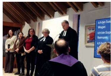
Gottesdienst am Samstagabend: die fünf Gäste aus Ungarn stellen sich vor.

Herzlichen Dank an alle im ÖZ, die den Besuch ermöglicht und mit helfenden Händen zum Erfolg gebracht haben! Für 2027 sind wir wieder nach Nyíregyháza eingeladen, mit der Hoffnung verknüpft, dass auch katholische Teilnehmende dabei sein werden.