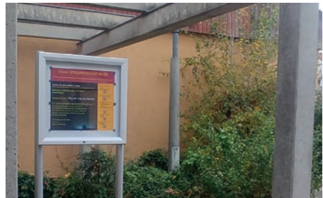
Das Staunfenster im Innenhof des ÖZ

„Das Staunfenster hat schnell meine Neugier angestachelt. Immer zu Monatsbeginn schaue ich, wer mir da vorgestellt wird. Zwei Parallelen aus der Kinderzeit fallen mir ein: Wundertüten habe ich geliebt, die Spannung, welche Überraschung wohl diesmal wartet, war ein echter Dopaminbooster. Und dann gab es das Schaufenster des Spielwarengeschäfts in unserem Stadtteil. Ein Fußweg von einer Viertelstunde war es wert, dort mit Freundinnen oder meinen Schwestern hinzupilgern. Das Staunfenster liegt für mich ja glücklicherweise nicht so weit weg. Weil ich zu den Oldies gehöre, die ohne Handy aus dem Haus gehen, bleiben allerdings die QR-Codes für mich ein Rätsel. Die abwechs-