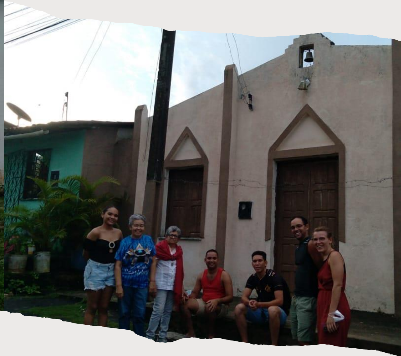
Besuch in Pacoti